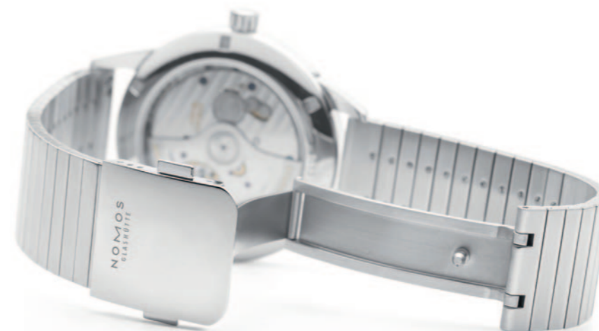
Il nuovo bracciale in acciaio, composto da 145 elementi avvitati a mano, è dotato di una chiusura pieghevole personalizzata con pulsanti di sicurezza.