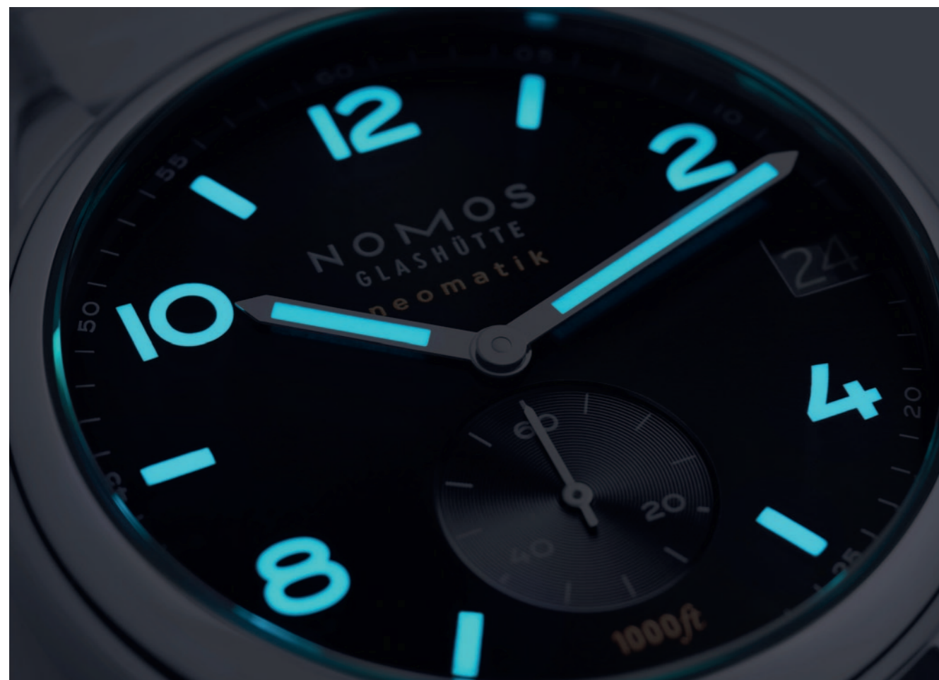
Lancette e indici del Club Sport sono cosparsi di sostanza luminescente blu. IN ALTO Il Tangente Update è disponibile anche con quadrante in rutenio (Ref. 181, prezzo di 3.200 euro). Il cinturino è in pelle di colore nero.